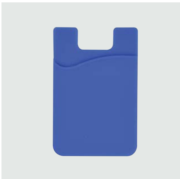
TEC 252 Mobile Stark