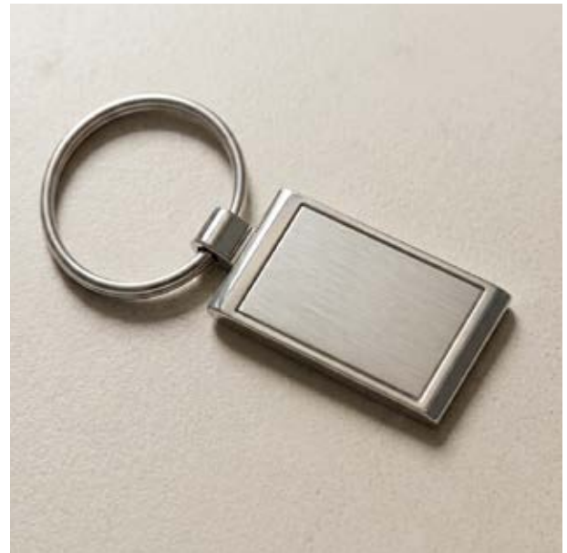
LLA 22 Llavero Rectangular Sencillo Plano