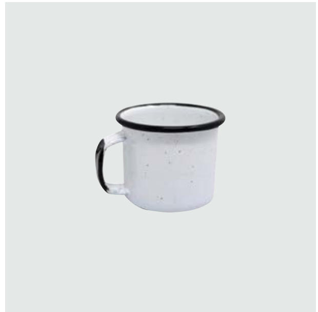
TH 212 Shot-Tequilero