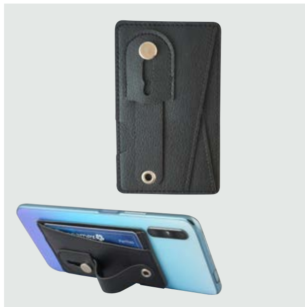
TEC 244 Tarjetero Hook

Material: Plástico y Silicón Medida: 6.2 cm diámetro