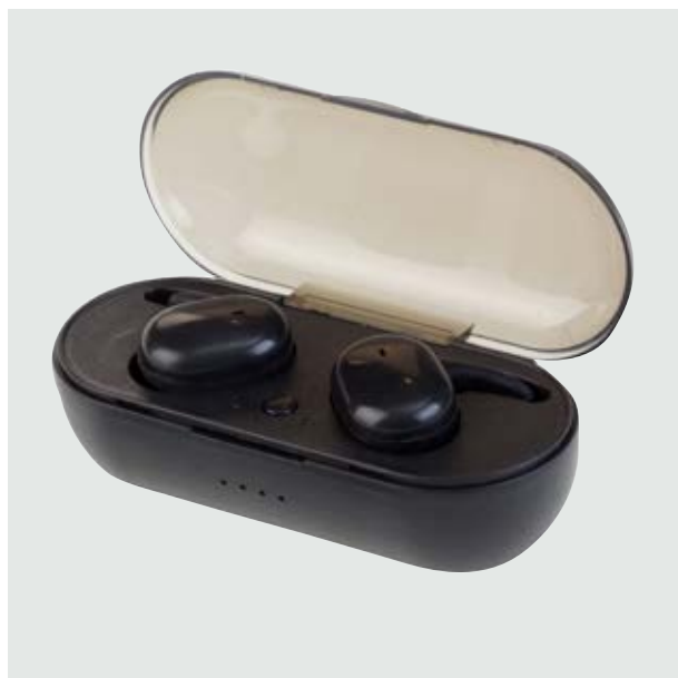
TEC 03 Audífonos Franklin ■