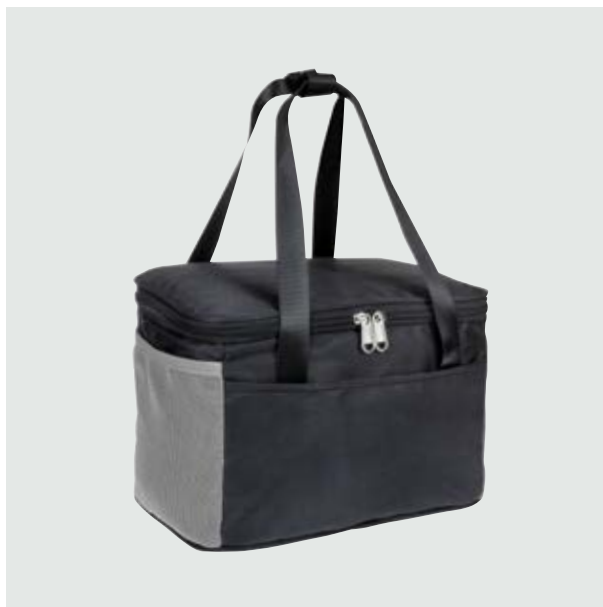
MAL 115 Lonchera Luca