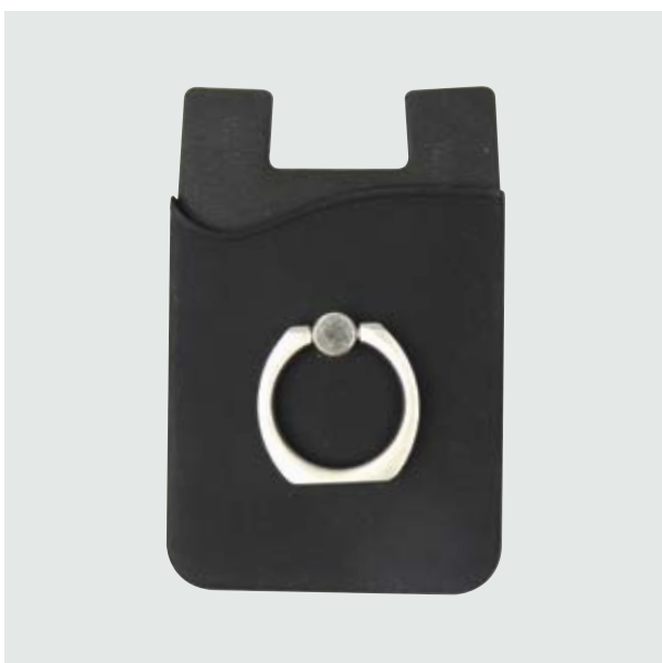
TEC 257 Mobile Tesla