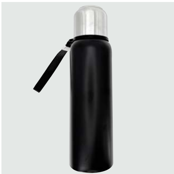
TH 29 Termo Nogal