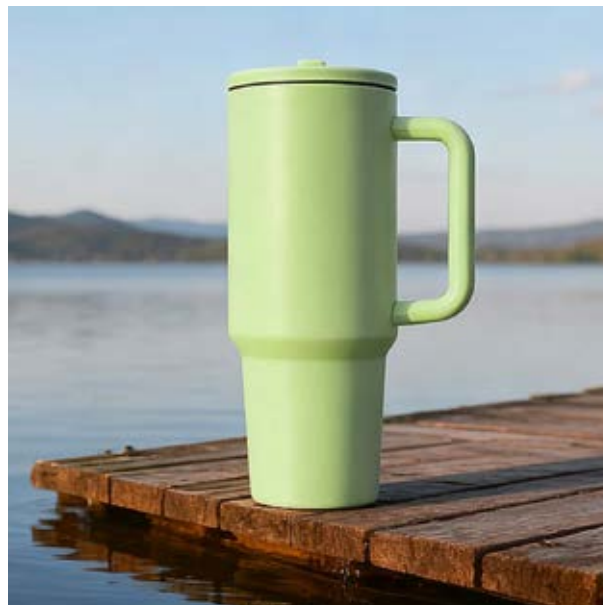
TH 31 Termo Flox