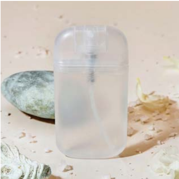
SAL 05 Oxy Sanitizer