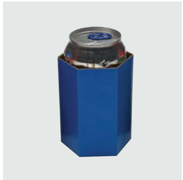
TH 306 Card Can-Holder